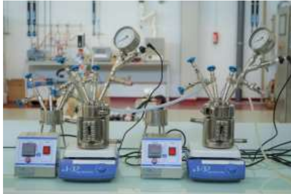
Illustration de deux mini-bioréacteurs instrumentés sous pression

Exemple d'essai : étude de l'influence de la pression sur la croissance de cultures de levures avec un suivi de la concentration du glucose, de la concentration cellulaire et de la production de glycérol/éthanol. Ces équipements permettent un suivi en temps réel de la pression relative et de la densité cellulaire. Le suivi de la concentration cellulaire est assuré grâce à un système d'atténuation d'un faisceau laser à travers la culture. L'objectif consiste à mettre en place des corrélations entre comptage cellulaire par un compteur de particule et l'atténuation du faisceau laser au cours de culture. De même, la pression relative est générée grâce à la génération de CO 2 , corrélée avec la quantité de glucose apportée initialement à la culture. Ainsi, une corrélation a été mise en place entre la concentration de glucose initiale et la pression relative induite dans ces mini-bioréacteurs. Un modèle mathématique a été développé, traduisant cette relation entre glucose apporté et pression relative imposée, ce qui nous permet d'assurer une régulation de la pression au sein de nos équipements.